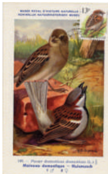
réalisation personnelle carte du musée