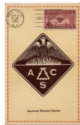
deux oblitérations "premier jour"