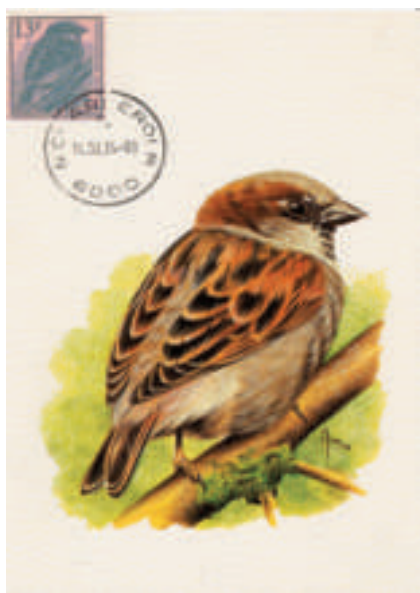
carte réalisée à partir d’une carte Buzin et d’un timbre découpé d’un entier postal

Les ”directives pour l’utilisation des règlements permettant d’évaluer les présentations thématiques” émanant de la Fédération Internationale de Philatélie (F.I.P.) précisent dans l’article 3.2.3. (Le matériel philatélique).✂